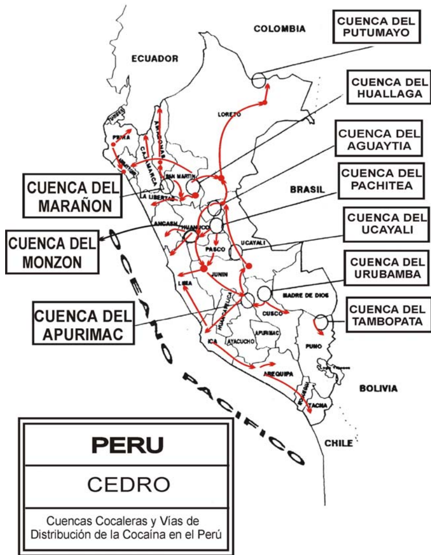
Gráfico 1. Cuencas cocaleras y vías de distribución de la cocaína en el Perú.

La hoja de coca producida en las localidades era vendida principalmente a los llamados 'traqueteros'. Se trata de personas que se encargaban de comprar la materia prima a los campesinos y pequeños productores, para luego venderla a las firmas recolectoras o acopiadoras, quienes se encargaban de su conversión en droga y posterior comercialización.